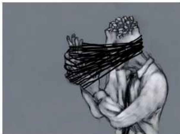
Luca Matti - Inestricabilmente, still da video.