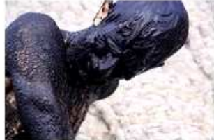
Jacopo Jenna - luxaeterna, still da video [Vedi la foto originale]

Roma - dal 29 marzo al 22 aprile 2012 Su Nero Nero, Over Black black #2