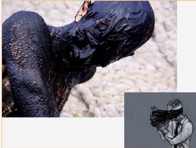
still da "Luxaetema" di Jacopo Jenna e da "Inestricabilmente" di Luca Matti

Giovedì 22 marzo alle ore 19 inaugura a Roma la mostra "Su Nero nero" curata dalla galleria Franzpaludetto [Via degli Ausoni n° 18] al fine di riflettere "sul potenziale estetico e semantico del Nero e sulla sua inesauribile capacità di fascinazione". Successivamente la nostra si potrà visitare fino al 22 aprile su appuntamento.